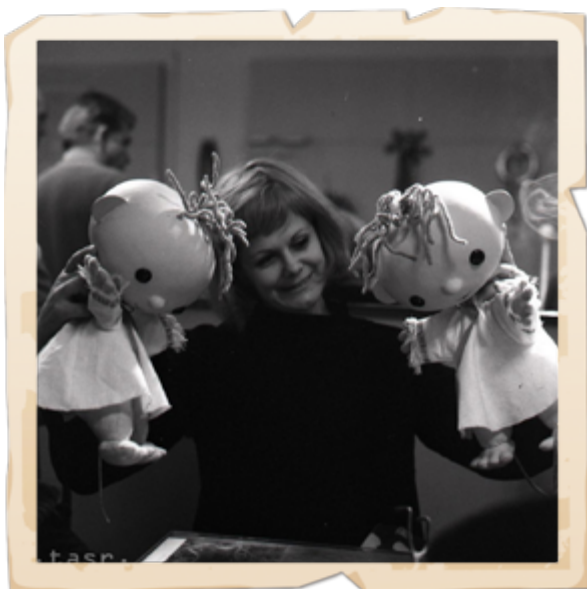
18. apríla 1972

A jeden fakt na záver, ktorý by si mal zapamätáť: Bábkové divadlo patrí medzi najstaršie divadelné formy v Európe – vzniklo ešte skôr, než mali mnohé mestá svoje stále kamenné divadlá.